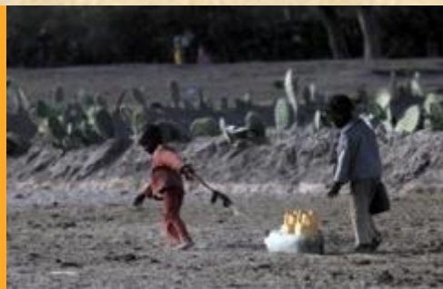
Na cestě pro vodu

Výstava fotografií Alžběty Jungrové Voda nad zlato bude v pražských Žlutých lázních ke shlédnutí od 10. do 26. června. Fotografie zachycují aktuální problémy v Etiopii, jedné z nejchudších zemí světa. Každodenní realita je zde bezprostředně ovlivňovaná nedostatkem čisté pitné vody. Vernisáž výstavy proběhne 10. června od 17 hodin v Praze 4 Podolí, ve Žlutých lázních. Vystoupí hudební a taneční skupina TiDiTaDe a po celé odpoledne bude k dispozici informační stánek Rozvojovky .