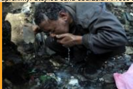
Etiopská realita

sérii snímků o dětech pracujících v cihelně v pákistánském Pěšáváru cenu Vysokého komisaře OSN pro uprchlíky. Stejnou cenu obdržela i v roce 2009 za sérii fotografií z barského uprchlického tábora v Bangladéši.