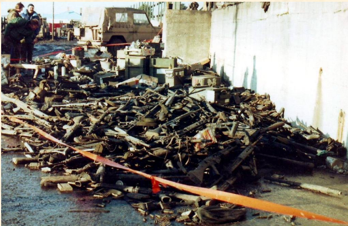
Zbraně zabavené Argentinským vojákům v Port Stanley

Válka ilustrovala jasně nutnost letecké převahy, kterou si Britové nebyli dlouho schopni zajistit, význam ponorek a průzkumu. Také zásobování bylo důležité, protože jednotky obou zemí se pohybovaly na hranici své působnosti.