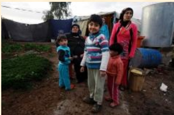
Uprchlíci ze Sýrie v iráckém uprchlickém táboře