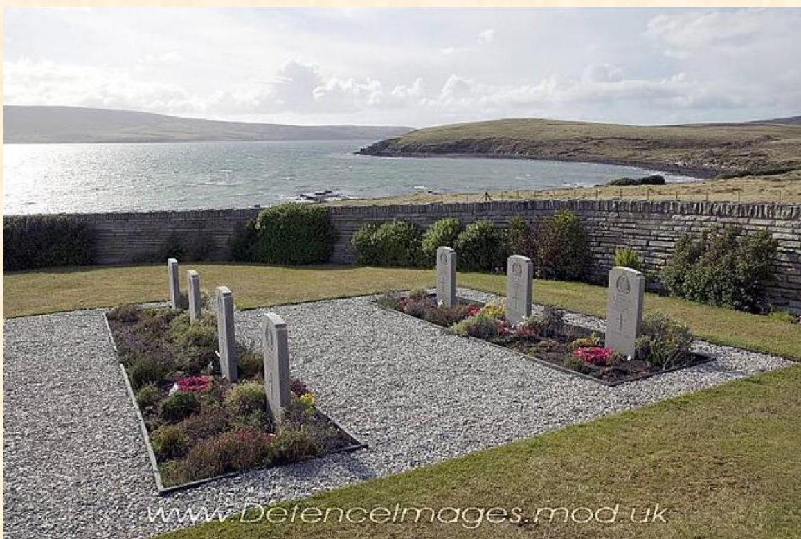
Britské válečné hroby na Mount Pleasant