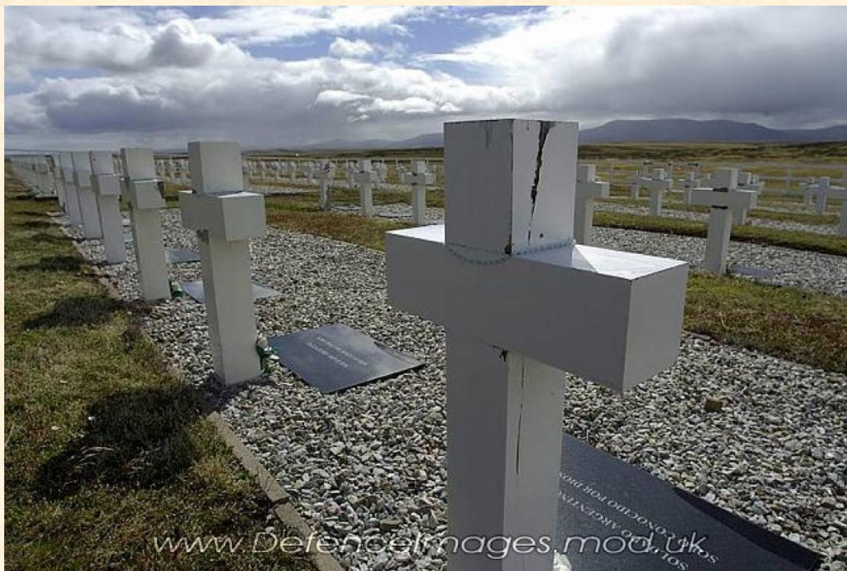
Argentinské válečné hroby u Darwinského přístavu