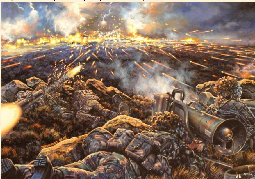
2 PARA v bitvě o Wireless Ridge

Během těchto dvou bojů ztratila Britská armáda 13 vojáků. Argentinská armáda přišla o 55 vojáků a více jak 230 jich padlo do zajetí.